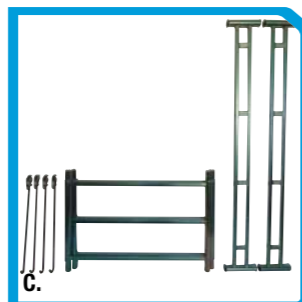
A. Livellatore con ruota a freno e puntone B. Composizione piano trabattello da 1,50mt C. Composizione piano trabattello da 1,00mt